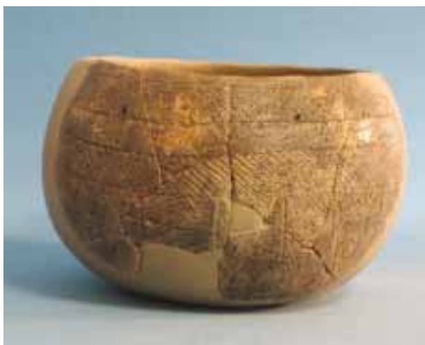
(fig. 14) Cuenco de la Cova Bolta (Museu de Gandia)