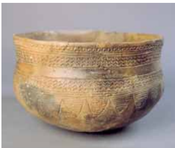
(fig. 13) Cazuela campaniforme completa de la Cova dels Gats, (Servicio de Investigación Prehistórica, Dip. Valencia)